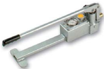
Handpomp voor handmatige machine-optie