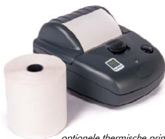
optionele thermische printer

In het geval van halfautomatische machines, kunt u in optie een unit voor datalogging nemen die continu de tijd, de druk en de temperatuur controleert en registreert, het hele verbindingsproces lang. Deze verbindingsparameters worden in het geheugen opgeslagen, om later te kunnen worden gedownload.