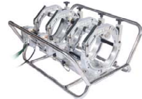
Chassis met draagslee