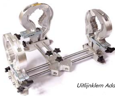
Uitlijnklem Adapter kit