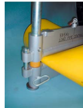
Leiding die dichtgeknepen wordt